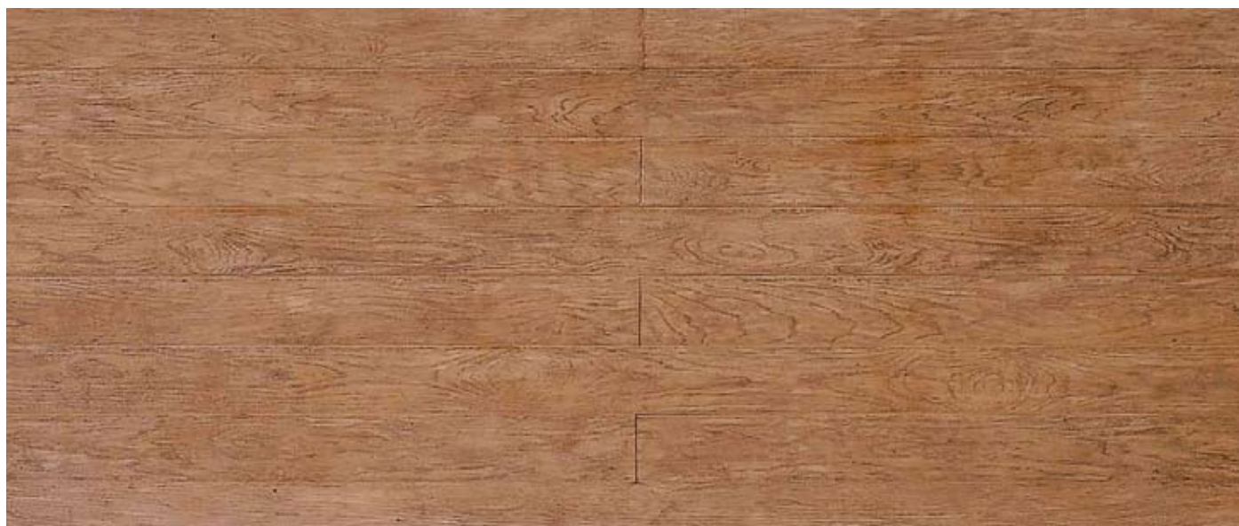
502 - Horizontal wood board 3,32 x 1,32 m