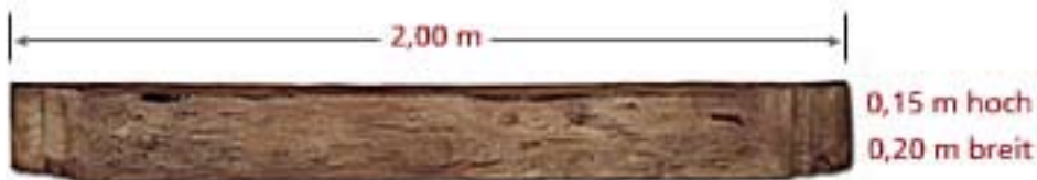
Wood Corbel CO H