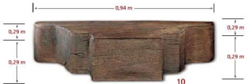
Wood Corbel CO J