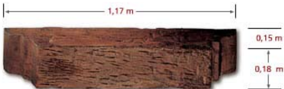
Wood Corbel CO G