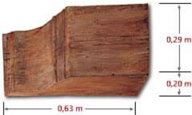
Wood Corbel CO D