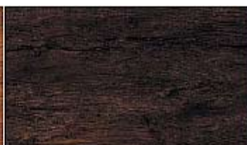
501 WD Walnuss dark