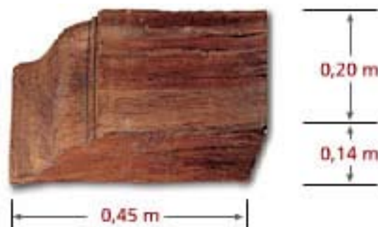
Wood Corbel CO C