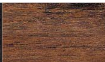
501 WM Walnuss medium