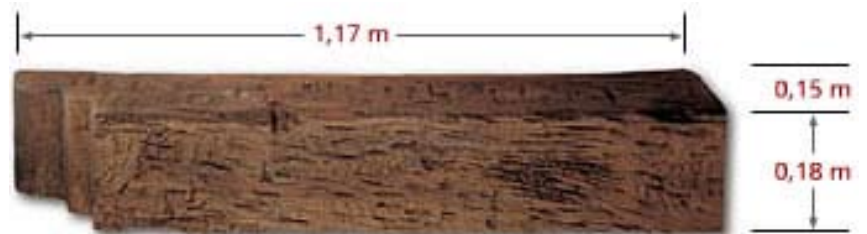
Wood Corbel CO F