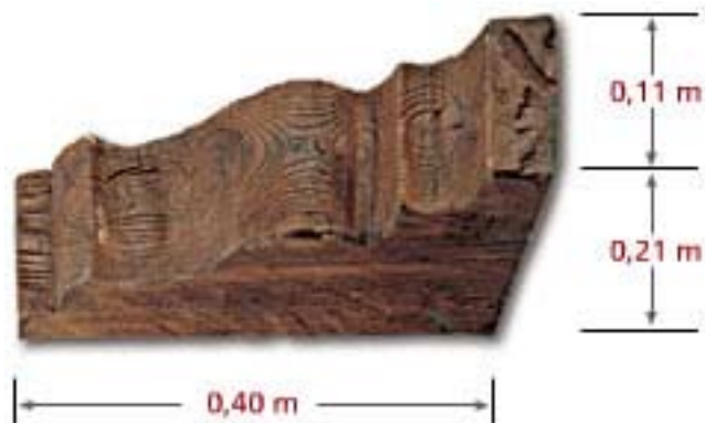
Wood Corbel CO A