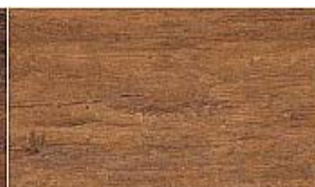
501 WL Walnuss light

Die Abbildungen zeigen das Muster der Paneele, sie stellen nicht die ganze Platte dar. Helligkeit und Farbtreue sind vom verwendeten Monitor abhängig und daher unverbindlich.