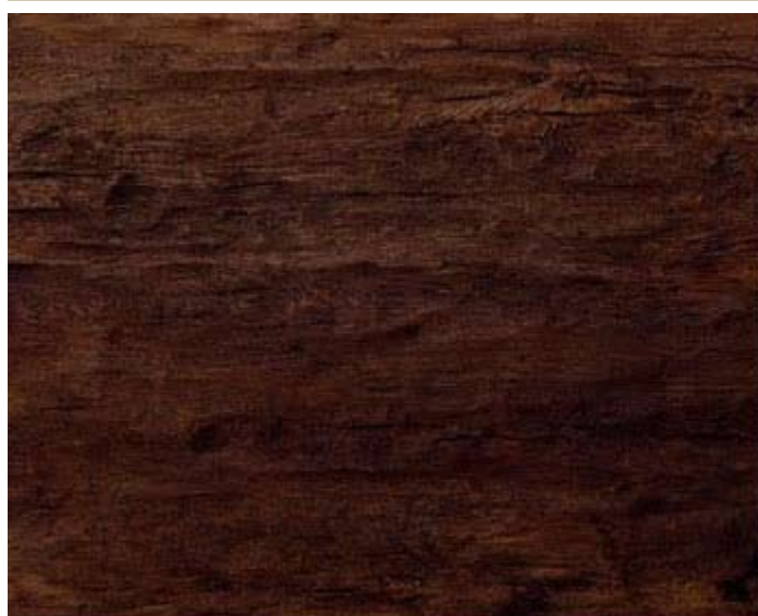
501 HD Haselnuss dark 3,40 x 1,35 m