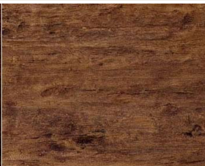
501 HD Haselnuss medium 3,40 x 1,35 m

Die Abbildungen zeigen das Muster der Paneele, sie stellen nicht die ganze Platte dar. Helligkeit und Farbtreue sind vom verwendeten Monitor abhängig und daher unverbindlich.