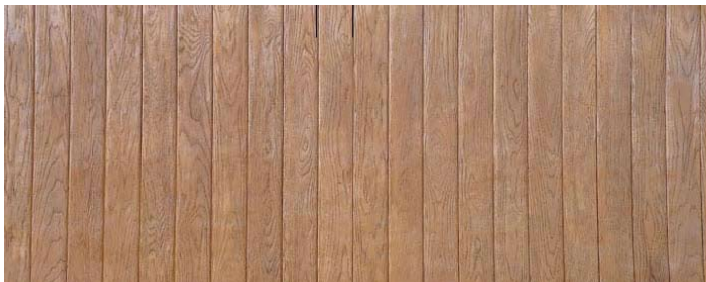
503 - Vertical wood board 3,32 x 1,32 m