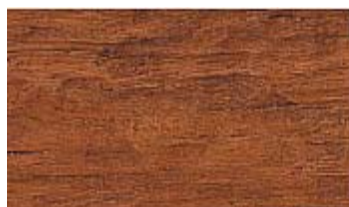
501 HL Haselnuss honey