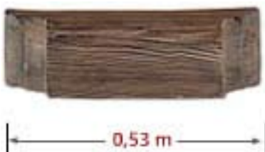
Wood Corbel CO E