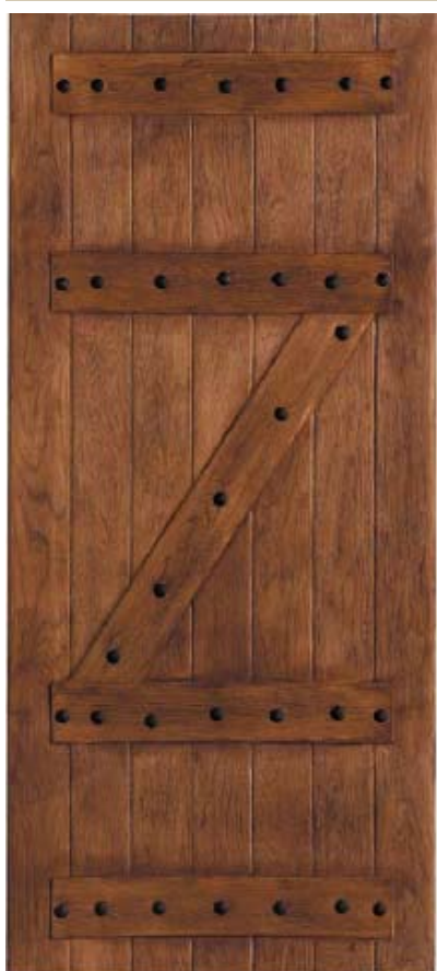
PR 01 - Rustic Door H= 2,14 m B = 0,92 m